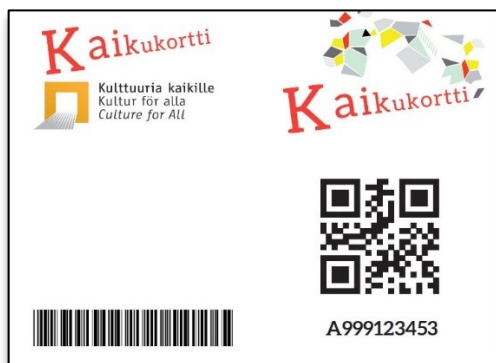
Kuva: Asiakkaan Kaikukortti, malli.

Kulttuuri kuuluu kaikille! Kaikilla on oikeus käydä konserteissa, festivaaleilla ja teattereissa vaikka oma taloudellinen tilanne olisikin hyvin tiukka. Ratkaisuksi tähän on kehitetty Kaikukortti.