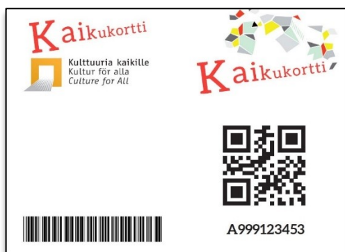
Kuva: Asiakkaan Kaikukortti, malli.

Kulttuuri kuuluu kaikille! Kaikilla on oikeus käydä konserteissa, festivaaleilla ja teattereissa vaikka oma taloudellinen tilanne olisikin hyvin tiukka. Ratkaisuksi tähän on kehitetty Kaikukortti.