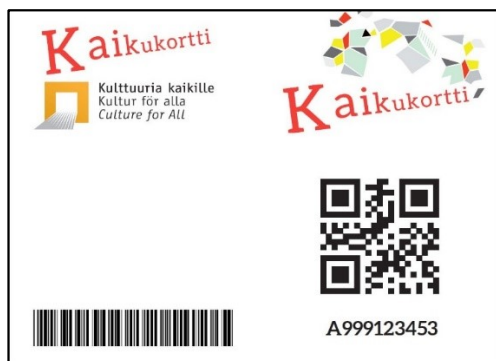
Kuva: Asiakkaan Kaikukortti, malli.

Kulttuuri kuuluu kaikille! Kaikilla on oikeus käydä konserteissa, festivaaleilla ja teattereissa vaikka oma taloudellinen tilanne olisikin hyvin tiukka. Ratkaisuksi tähän on kehitetty Kaikukortti.