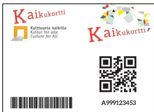
Kuva: Asiakkaan Kaikukortti, malli.

Kulttuuri kuuluu kaikille! Kaikilla on oikeus käydä konserteissa, festivaaleilla ja teattereissa vaikka oma taloudellinen tilanne olisikin hyvin tiukka. Ratkaisuksi tähän on kehitetty Kaikukortti.